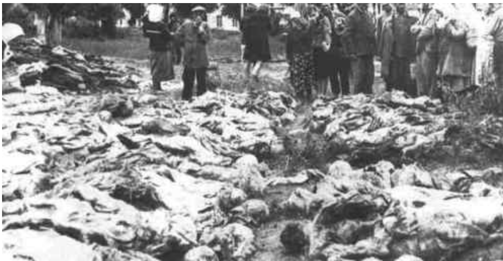
Fotografi af en af massegravene afdækket i Ukraine Denne ene indeholdt ligene af op til ti tusinde ofre, alle myrdet af det jødiske NKVD ved Vinnitsa.

Krigen startede, fordi jøderne opdannede den. Aksemagternes Hær blev budt velkommen som en "befrier" på tværs af østlige nationer. Jødisk styre under kommunismen havde allerede myrdet over 20 millioner uskyldige ikke-jøder. Syv millioner døde i det ukrainske holocaust alene, der blev overvåget af jøden Lazar Moiseyevich Kaganovich efter ordre fra jøden Stalin. Millioner flere døde i et system af dødslejre kaldet Gulagger, der hver blev drevet af en jødisk kommisær. Jøderne arbejdede dem ihjel med vilje, da det var for hurtigt at skyde dem.