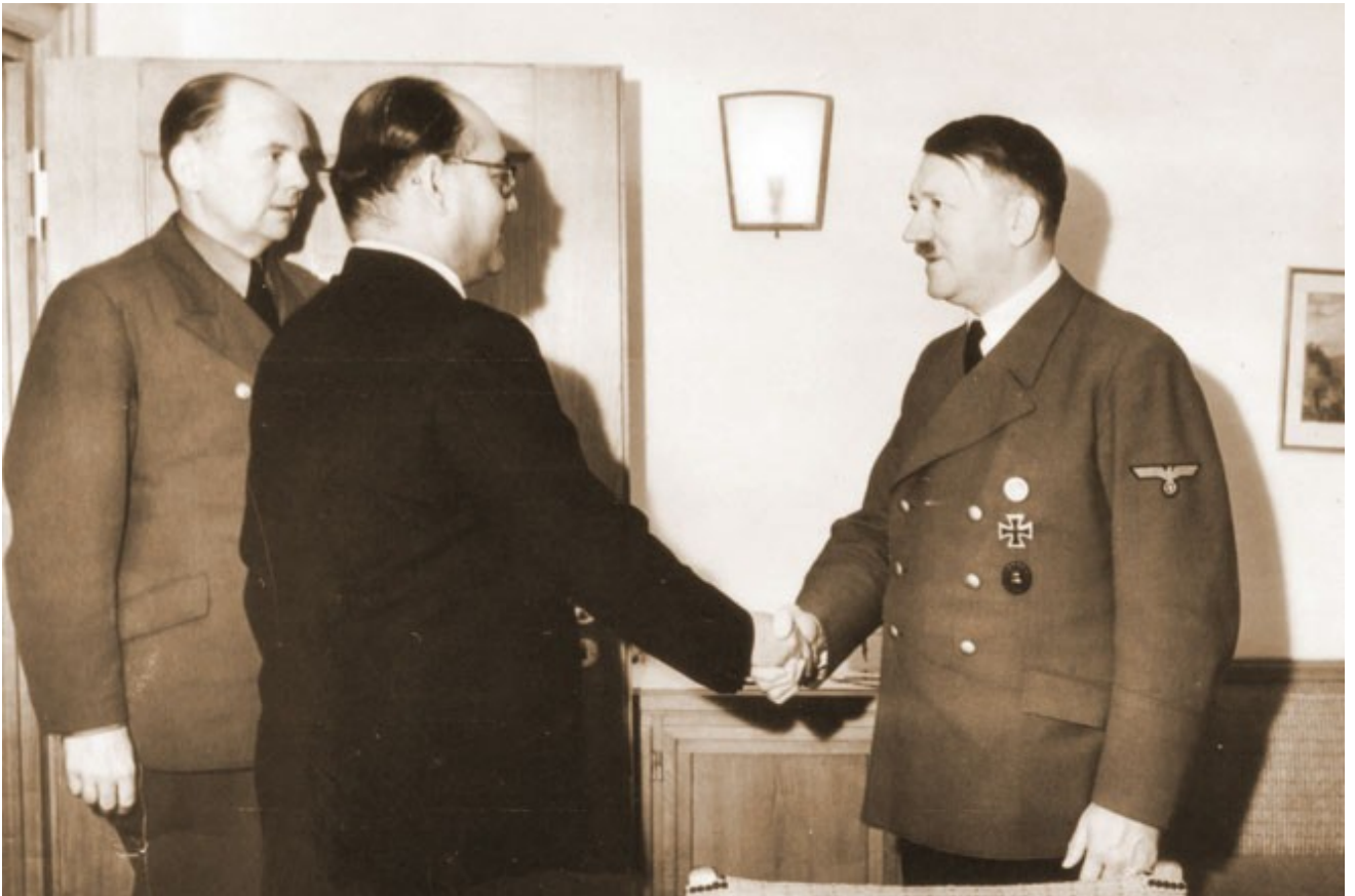
Hitlers møde med den indiske helt og nationalistiske leder, Chandra Bose

I en sort soldats (som tjente som kampsoldat i Hitlers Hær) memoirer erklærede han, at de sorte og hvide soldater havde samme kaserne, spiste ved de samme borde, havde lige rettigheder samt respekt og var venner. Hvor sorte, der tjente i den amerikanske hær, blev behandlet som underlegne og ikke engang fik lov til at spise ved samme bord som hvide. Som Hitler erklærede, er nationalsocialismen baseret på racemæssig respekt.