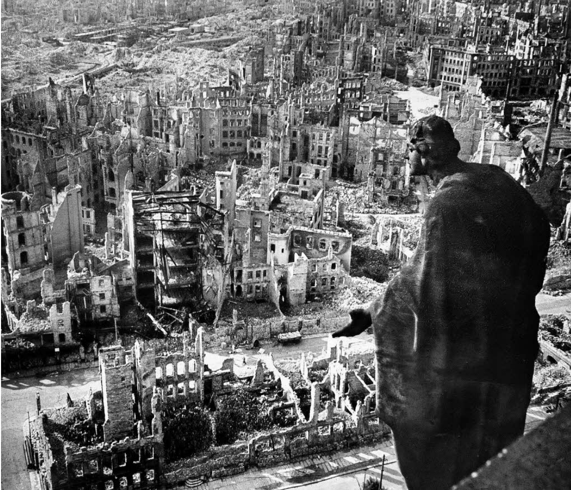
Dresden efter De Allieredes angreb

"I december 1944 blev Vonnegut taget til fange af den tyske hær og blev til en krigsfange. I Slaughterhouse Five beskrev han, hvordan han netop undgik døden et par måneder senere under brandbombningen af Dresden. "Ja, ved jeres folk (engelske), må jeg sige," insisterer han, "I brændte stedet ned, gjorde det til en søjle af ild. Flere mennesker døde der i den ildstorm, end der samlet set gjorde i Hiroshima og Nagasaki. Jeg holder af jeres folk, ved lejlighed, men jeg tænkte lige på "Bomber Harris", som gik ind for bombning af civile befolkninger for at få dem til at give op. En helvedes masse Royal Air Force fyre skammede sig over, hvad Harris havde fået dem til at gøre. Og det er virkelig sportsånd, og briterne er, naturligvis, berømte for deres gode sportsånd (Bemærk* "Harris" er et jødisk navn)."