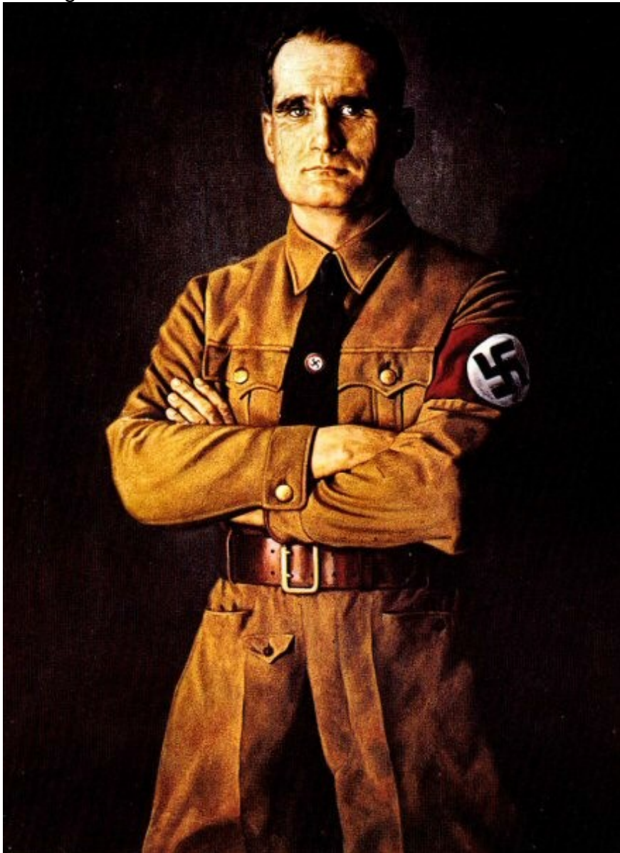
Rudolf Hess- Martyr for Fred

Hvis Hitler var det uhyr, som jøderne lyver og siger, han var, kunne han have vundet krigen. Hitler viste hele den britiske hær barmhjertighed ved Dunkerque og beordrede personligt sine generaler til at stoppe angrebet og tillade englænderne at tage afsted. Hitler skåned sine fjender, hvor han kunne have dræbt dem alle. Førhen, og stadig, havde Hitler arbejdet i døgn drift på at opnå fred med England. Mange ikke-jøder i England, herunder medlemmer af den kongelige familie, og selv den berømte T. E. Lawrence of "Arabia", var pro-nazistiske. Lawrence blev myrdet på vej til et vigtigt møde for at hjælpe med at indføre en fredstraktat med Tyskland før krigen.