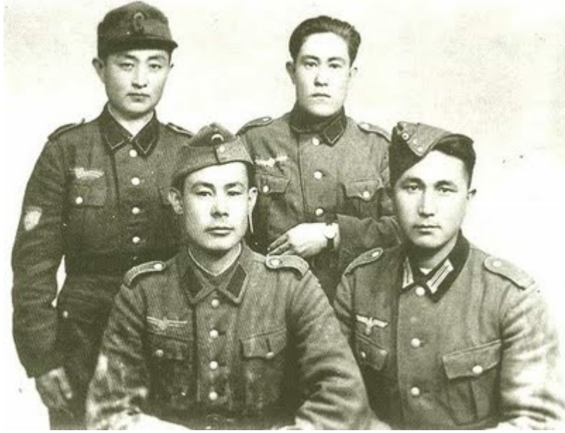
Asiatiske tropper som kæmpede i Hitlers Styrker