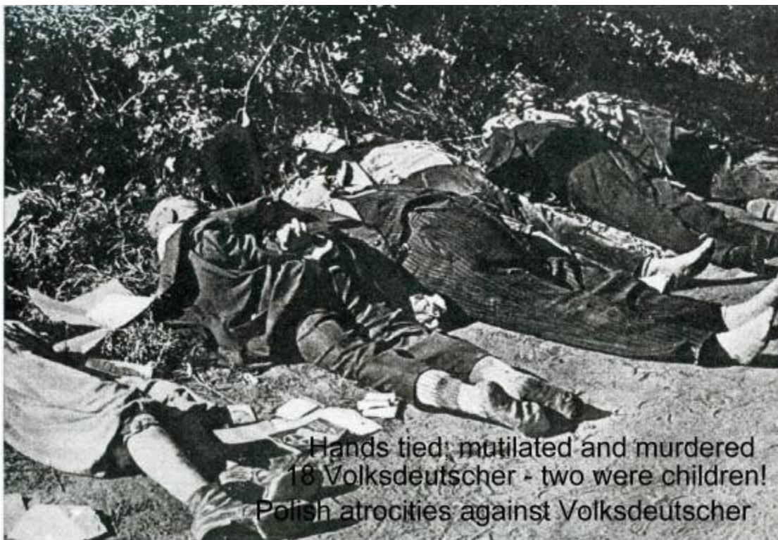
Nogle af de 50.000 ofre for Bromberg-massakren

Den amerikanske regering og dens jødiske regulatorer havde privat erklæret krig mod Tyskland i årevis. De samme metoder blev brugt mod Japan for også at tvinge dem ind i en krig. Det er ingen hemmelighed, at den amerikanske regering kendte til Pearl Harbor i flere måneder inden angrebene og undlod at gøre noget, da de ønskede en officiel grund til at gøre, hvad de hele tiden havde gjort.